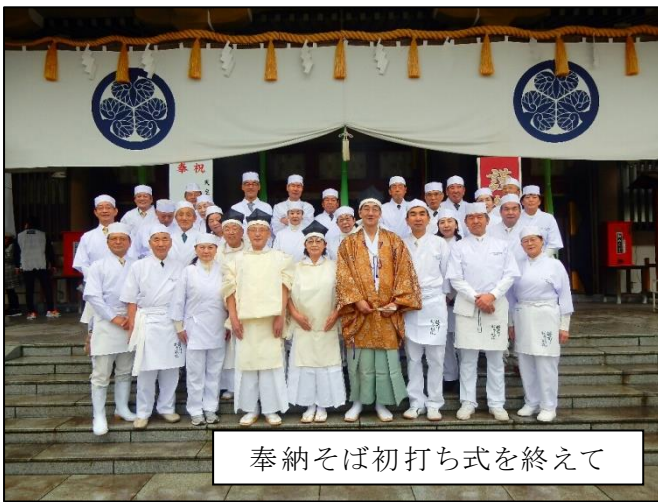
奉納そば初打ち式を終えて