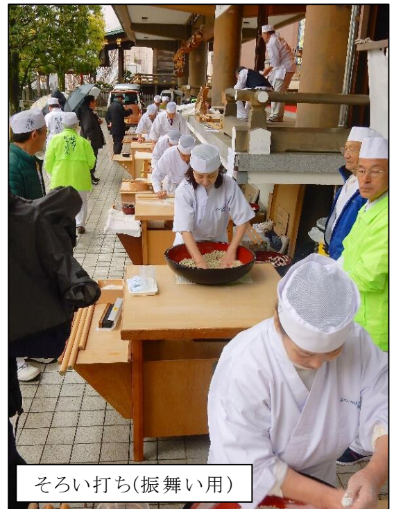
そろい打ち(振舞い用)