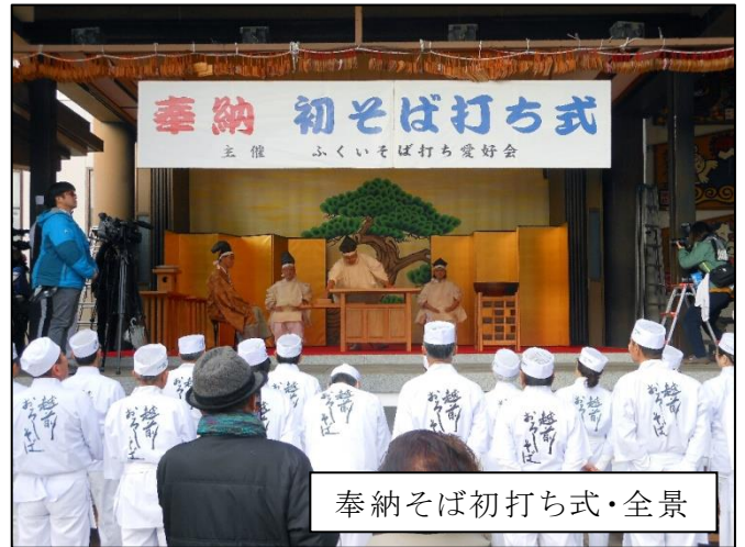
奉納そば初打ち式・全景