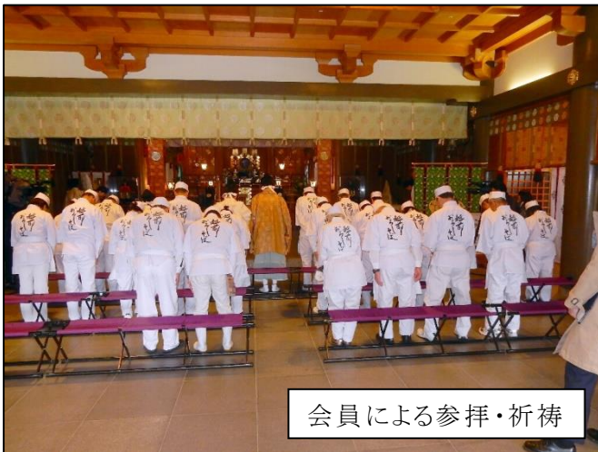
会員による参拝・祈祷